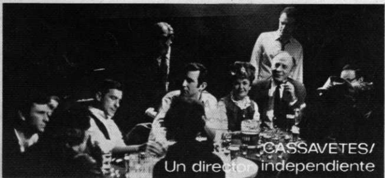
CASSAVETES/ Un director independiente