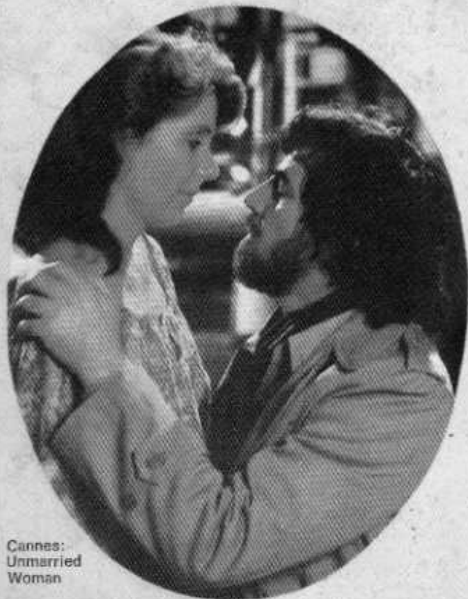
Cannes: Unmarried Woman