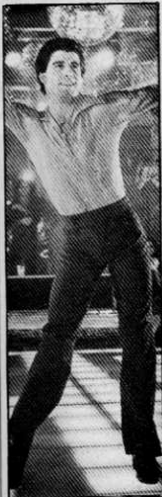
TRAVOLTA Sacudones exitosos

Para captar a espectadores jóvenes (la mitad de los espectadores cinematográficos de Francia tiene menos de 24 años y sólo 9 de cada cien tiene más de 50, aunque el 42% de la población francesa es mayor de 50 años), los films que se producen deben apuntar a anchas cuotas de inconformismo, utilizar personajes preferentemente jóvenes, mostrar las quiebras generacionales y describir el medio social como un ámbito hostil donde la lucha por la vida (la de los jóvenes) es la regla. La otra opción consiste en proponer plácidas y soñadas visiones de un paraíso perdido donde los conflictos existenciales se reducen al juego de sentimientos, quietas explicaciones sobre gente bien educada que mira las cosas con filosofía. Esos dos extremos (la pugna o la evasión) son los que el cine aporta (además de notables dosis de erotismo y de una docena de películas de calidad) para responder a ese mercado consumidor, donde sólo el 3% de los espectadores provienen del medio agrícola y donde mucha gente no tiene la ocurrencia de ir al cine. Los jóvenes descubren allí explicaciones precarias de la vida, reciben una posible enseñanza sobre la convivencia sin molestarse en aprenderla de cara a la vida. La pregunta obvia es qué tienen que ver esas motivaciones muy europeas con las necesidades de espectadores latinoamericanos, uruguayos en particular. Y el peligro obvio es que mucho uruguayo distraído crea que la vida es esa ficción que proviene del Mercado Común Europeo o quizás de Hollywood.