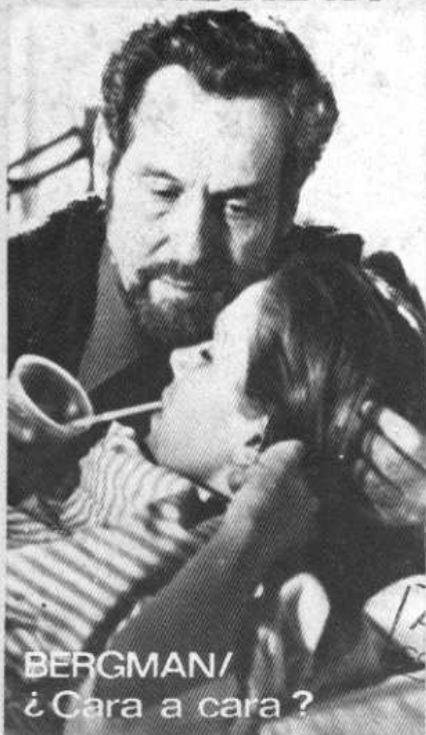
BERGMAN/ ¿Cara a cara?