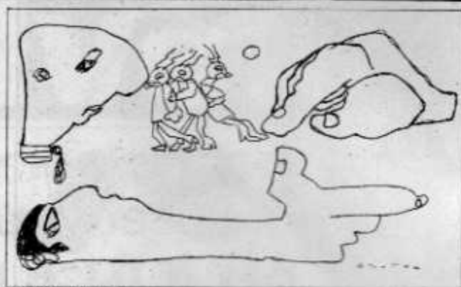
CIENCIA FICCIÓN Solución ante la crisis

Los impuestos se han constituido en insospechables enemigos de la actividad artística para los hombres de cine. Fuera de los juicios, más comunes, en que los actores son acusados y perseguidos por evadirlos, hace poco tiempo Ingmar Bergman constituyó un caso de particulares consecuencias. Quienes lo acorralaron con sospechosas preguntas —hasta hacerlo partir de su Suecia— resultaron después cuestionados por el sistema legal que pretendían defender, además el partido socialdemócrata, que gobernó al