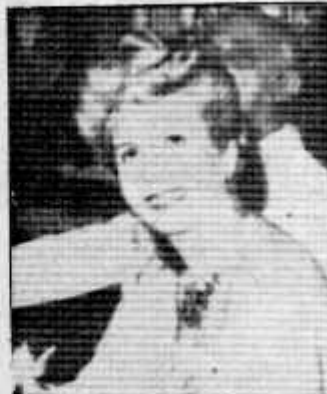
EVITA PERÓN Maticismo de una mujer

Primero fue un "musical" de dos famosos autores. Luego se hizo el traslado a lo cinematográfico. Ahora se quiere repetir esa experiencia, la de Jesucristo Superstar. El tema propuesto es la vida de Evita Perón, una mujer de singular personalidad, adorada por buena parte de los trabajadores argentinos ("los descamisados"), que inspiró hace varios meses a Lloyd Weber y Tim Rice una ópera "rock", similar a la que los mismos autores habían realizado con Jesucristo, a pesar de que siempre se negó tales vinculaciones. Ya la versión musical hacía de Evita una mirada muy libre y particular sobre la mujer argentina más popular, introducen suficientes modificaciones al libreto que comienza con la muerte de Evita, retomando después su vida desde 1934, en Junín, cuando Eva Duarte le pide a un cantante del club que la lleve a la gran ciudad: el hombre sería en poco tiempo conocido co-