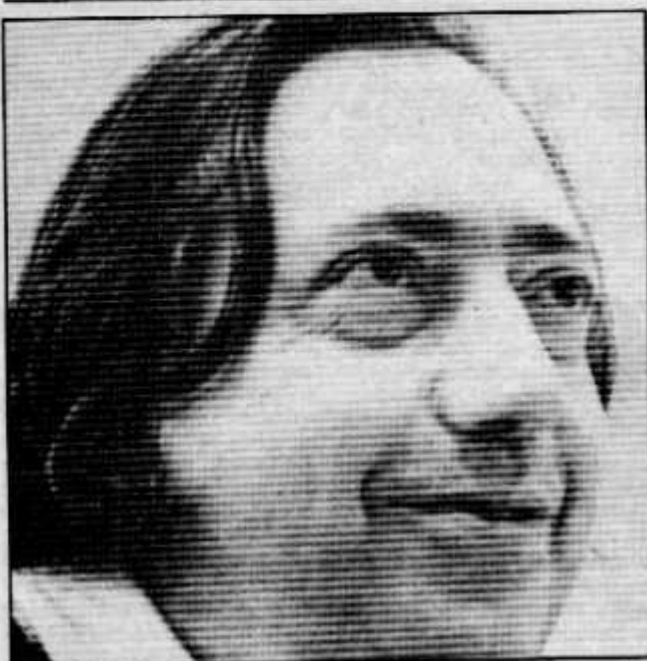
HENRI LANGLOIS La Cinémathèque amenazada