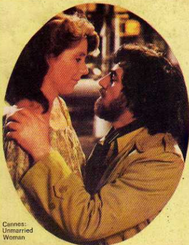
Cannes: Unmarried Woman