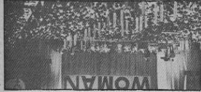
MUJERES ¿Primer film feminista?

Los juzgadores de lo sono mia podrán tener razón en cuanto a los va- lores del film; lo que no es nada deseable —pa- ra reconquistar al públi- co— son esas fórmulas de respeto.