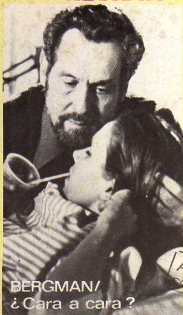
BERGMAN/ ¿Cara a cara?