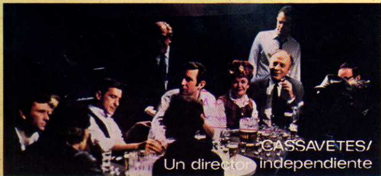
CASSAVETES/ Un director independiente