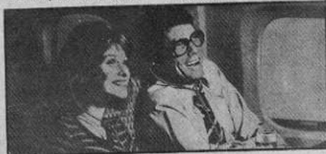
PANAM Nada de cine mudo

no un estudiante de inglés, futuro emigrante hacia los Estados Unidos; la historia del funcionario público Carloncho con sus típicas borracheras solitarias y la figura de Patricia, joven estudiante universitaria que no quiere seguir el camino de sus mayores. Sin embargo, la frustración latente aparece en los cuatro bajo la soledad del aymará, el instinto delictivo de Johnny, el sinsentido de Carloncho y las transacciones de Patricia. Una imagen única que se eleva como la realidad de una ciudad llamada La Paz. Ese es el logro mayor señalado al film, que supera inclusive a los defectos técnicos propios de las condiciones de filmación. Inversamente a lo que pasa en otros lados, por ejemplo, los realizadores bolivianos deben esperar cerca de un mes, después de rodar, para ver el material revelado, ya que no existen laboratorios adecuados en el país. Y ese no es el menor problema, claro.