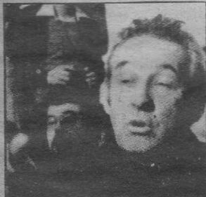
ANDRZEJ WAJDA Director

No es la primera vez que una cosa así sucede. Las distribuidoras multinacionales suelen estar alertas sobre algunos talentos del cine y, cuando creen que tienen un éxito en la mano terminan llevándose las películas porque, claro, son competidores que no pueden tener oponentes debido a la calidad de la oferta que normalmente hacen a los productores. La misma United Artists tuvo en sus manos a Gláuber Rocha,