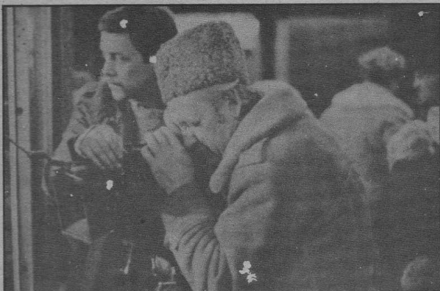
EL HOMBRE DE HIERRO La toman los norteamericanos