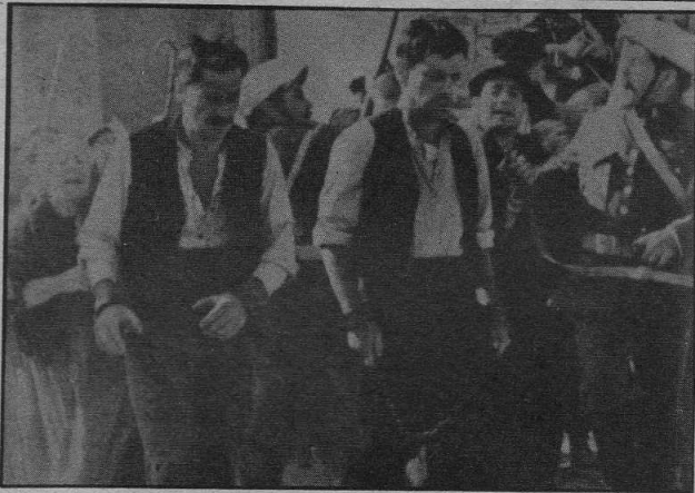
EL CRIMEN DE CUENCA Un enfoque realista