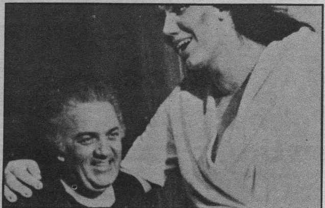
FELLINI La televisión no lo somete

blico ha ganado poder a expensas de las películas, y el cine se ha convertido en una vieja dama coja."