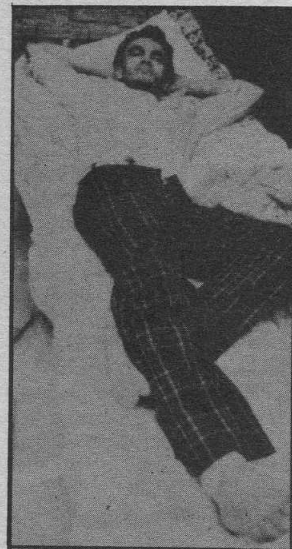
EL HOMBRE Que se hizo jugo

rumana La pálida sonrisa del dolor, uno de los trabajos que mereció mayores elogios. De América Latina, las representaciones argentina (con Sergio Renán presente) y mexicana parecieron decepcionar mientras los peruanos provocaron algún llamado de atención a nivel de comentarios.