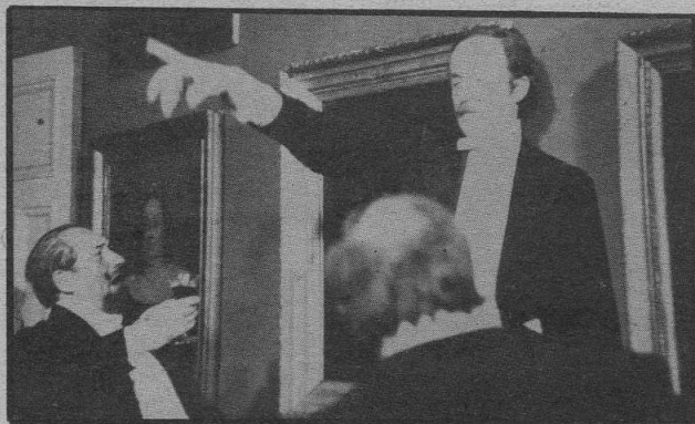
JULIO COMIENZA EN JULIO Chileno significativo