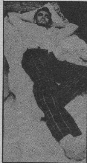
EL HOMBRE Que se hizo jugo

rumana La pálida sonrisa del dolor, uno de los trabajos que mereció mayores elogios. De América Latina, las representaciones argentina (con Sergio Renán presente) y mexicana parecieron decepcionar mientras los peruanos provocaron algún llamado de atención a nivel de comentarios.