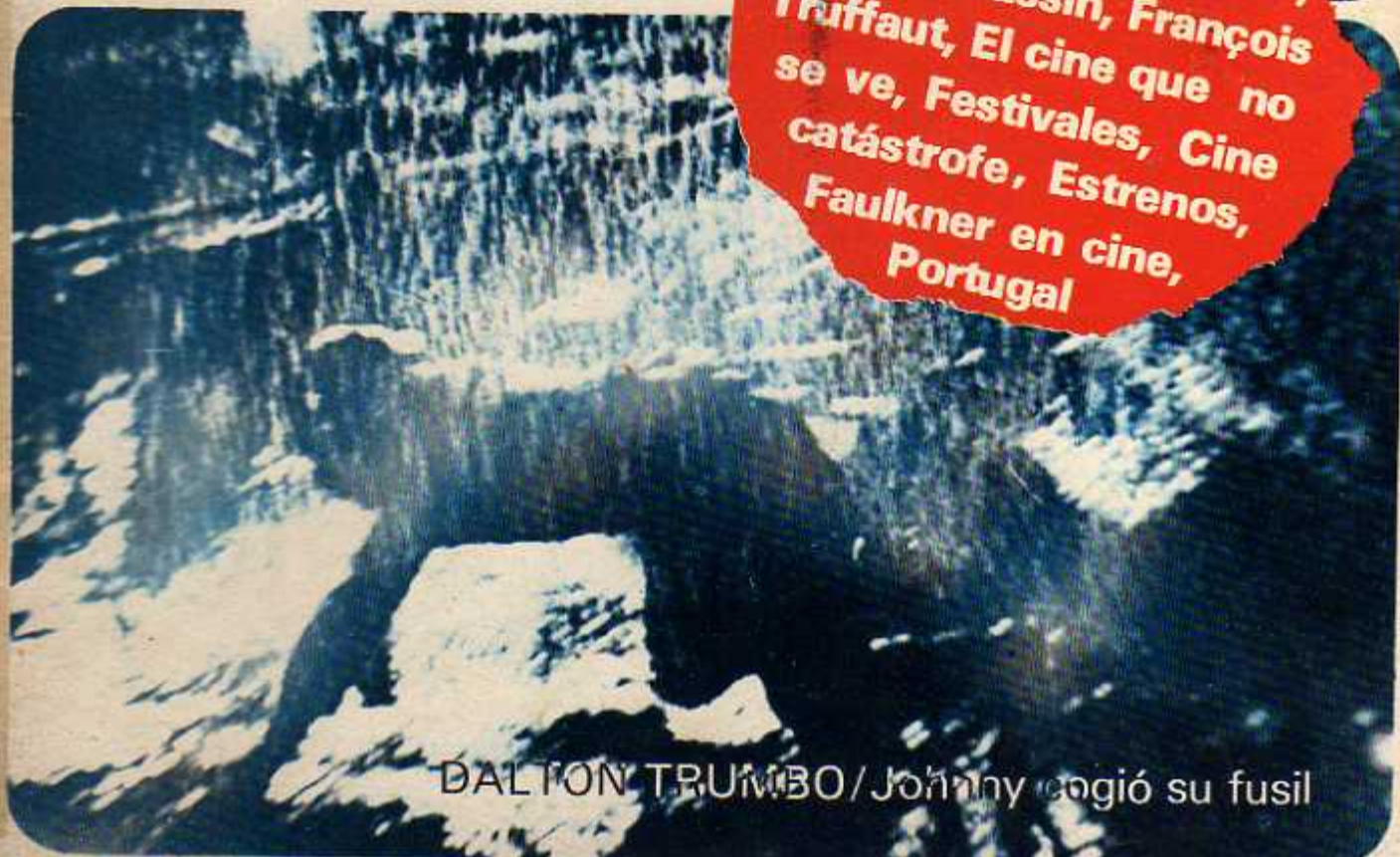
DALTON TRUMBO/Johnny cogió su fusil

Hollywood en crisis, Jules Dassin, François Truffaut, El cine que no se ve, Festivales, Cine catástrofe, Estrenos, Faulkner en cine, Portugal