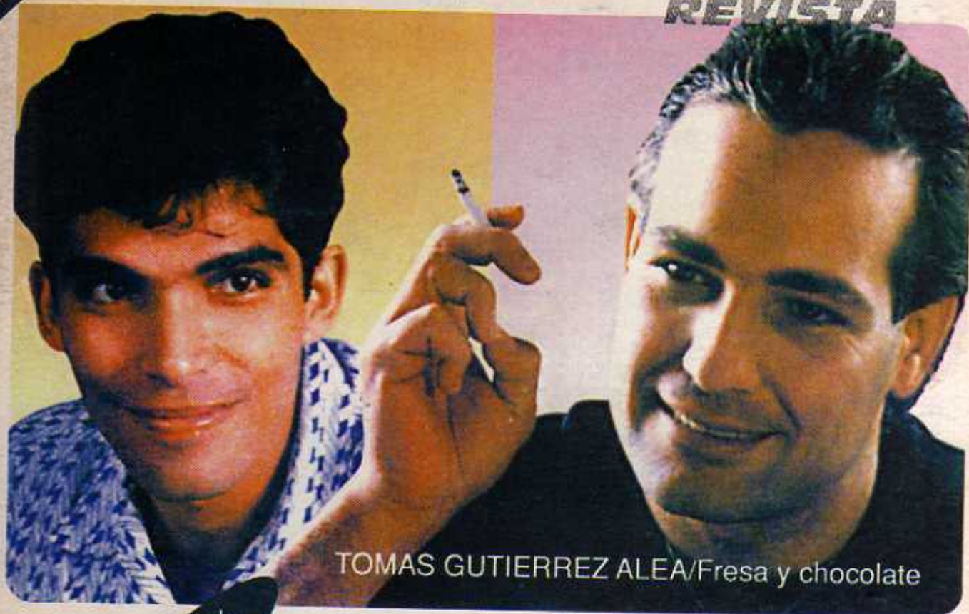
TOMAS GUTIERREZ ALEA/Fresa y chocolate