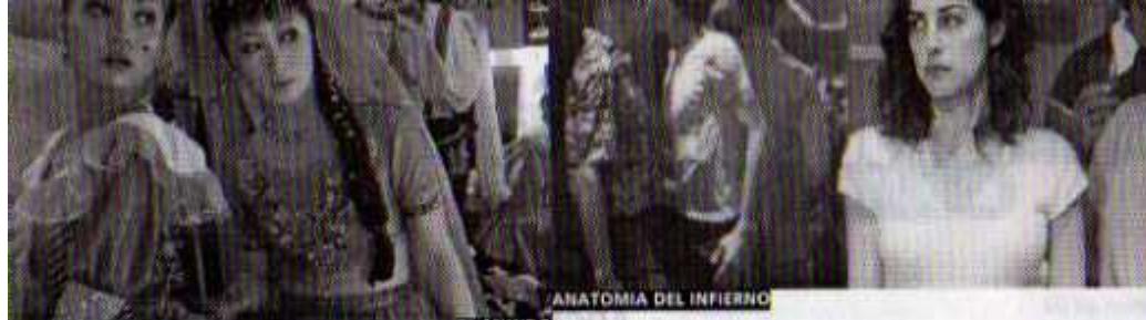
ANATOMÍA DEL INFIERNO EL MUNDO