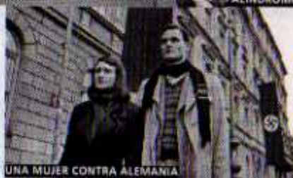
UNA MUJER CONTRA ALEMANIA