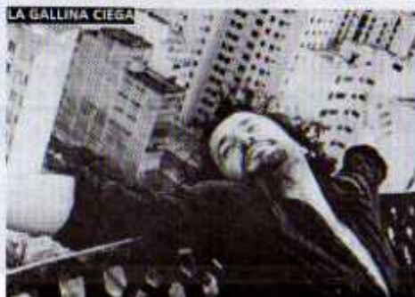
LA GALLINA CIEGA

Segunda Guerra Mundial. A un sacerdote católico internado en Dachau se le concede una "salida transitoria" para asistir al funeral de su padre... y tratar de persuadir a su obispo de que deje de combatir al nazismo y solicite al Vaticano apoyo a Hitler. Un drama basado en hechos reales por el director de El tambor .