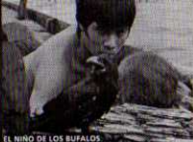
EL NIÑO DE LOS BUFALOS

Cinemateca 18, Viernes 7, 19.30 hs. Sala Cinemateca, Jueves 6, 19 hs. Pocitos, Sábado 8, 19 hs.