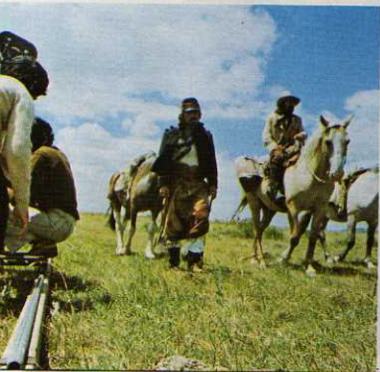
Alumnos de la Escuela en trabajos prácticos.

El Departamento de Producción de Cinemateca Uruguay es la sección de más reciente creación. Ha realizado varios cortometrajes y habrá de concluir en abril 1981 el rodaje de su primer film largo, "Mataron a Venancio Flores". De estreno inminente, "A la deriva", adapta un relato de Horacio Quiroga. El Departamento de Producción se propone incentivar a través del cine una actitud creativa a partir de coordenadas culturales propias, entendiendo al cine como uno de los hechos artísticos de mayor importancia en la civilización contemporánea y partiendo de que el cine en el Uruguay es una de las formas de expresión propia más infrecuente y de difícil financiación. La necesidad y urgencia de un cine nacional (y no meramente uruguayo) determinó en 1979 la creación de este Departamento.