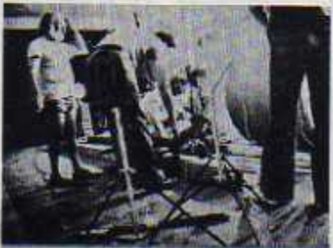
Left filming a short film. Right filming an outdoor scene of full length film "They Killed Venancio Flores" (Mataron a Venancio Flores).